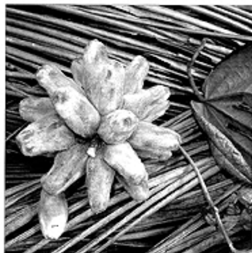
La liane phytocrène aux propriétés prometteuses pour les Hamiqs, les étrangers.

"Ses feuilles sont amères ! On ne les mange pas mais on les porte en amulette autour du cou pour soigner les boutons au visage... les migraines, les maladies de peau... pour son agréable parfum aussi ! On peut aussi les réduire en poudre pour désinfecter les plaies."