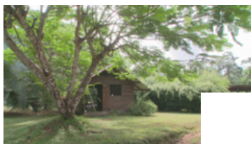
PAD CENTRE DE SOIN FAUNE SAUVAGE