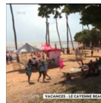
Cayenne beach formule toujours public