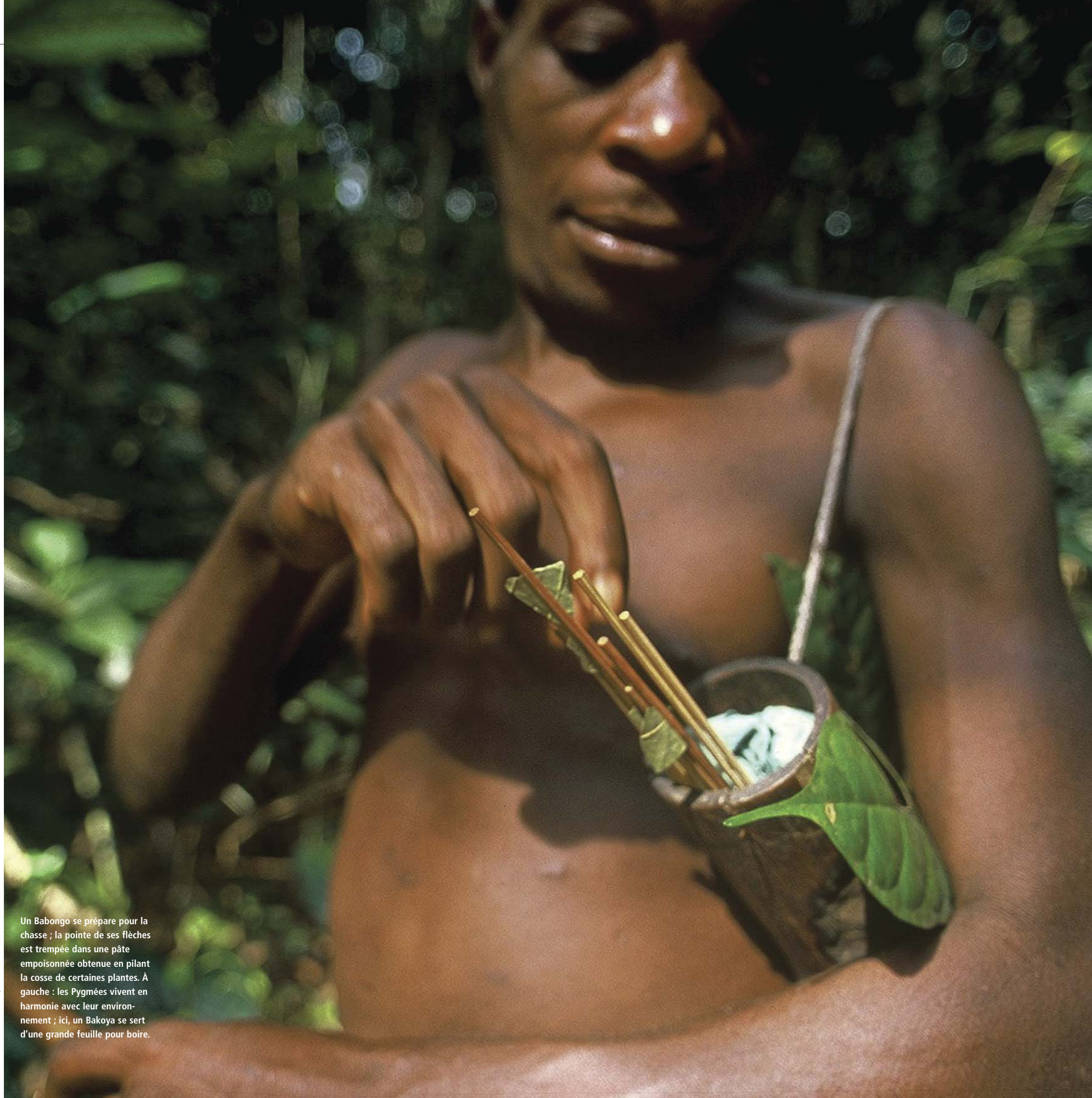
Un Babongo se prépare pour la chasse ; la pointe de ses flèches est trempée dans une pâte empoisonnée obtenue en pilant la cosse de certaines plantes. À gauche : les Pygmées vivent en harmonie avec leur environnement ; ici, un Bakoya se sert d'une grande feuille pour boire.